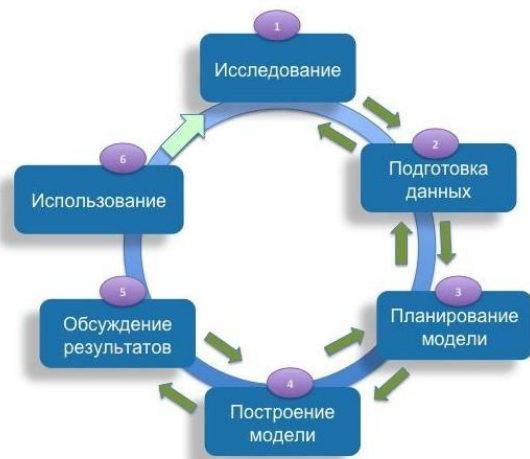
Рисунок 1 - Диаграмма жизненного цикла проекта аналитики больших данных

На рисунке 1 приведена диаграмма жизненного цикла проекта аналитики больших данных.