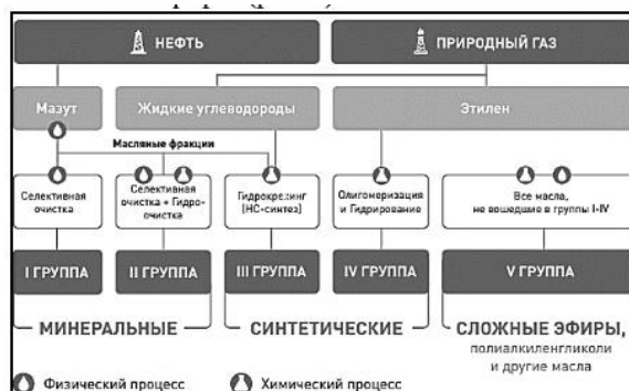
Рисунок 1 – Типы базовых масел и способы их получения [3]

В зависимости от используемого сырья и методов получения готовые базовые масла делятся на три типа: минеральные, синтетические и сложные эфиры (рис. 1).