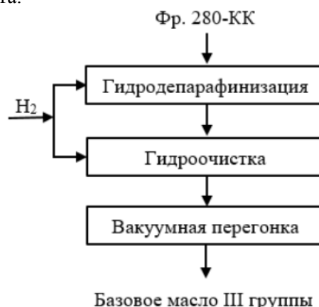
Рисунок 3 – Схема производства базового масла III группы на Ангарском НПЗ

зарубежных перерабатывают намного меньше сырья в производстве масел и смазочных материалов, что напрямую влияет на объемы производимой готовой продукции и не позволяет расширить объемы и рынки сбыта.