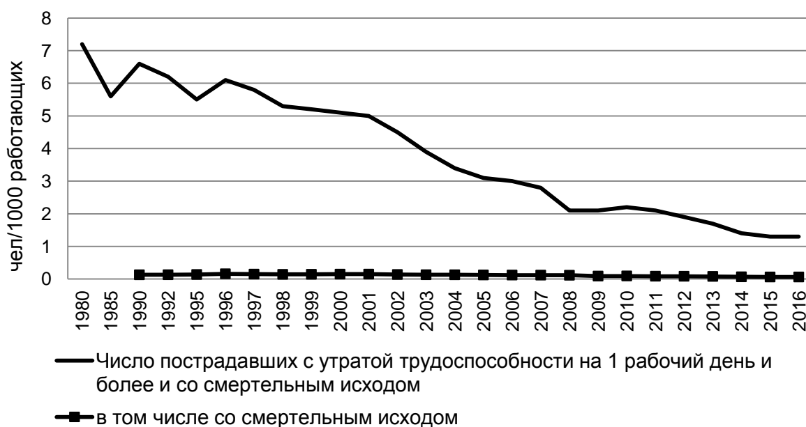
Рисунок 1 - Динамика производственного травматизма в РФ за период 1980 - 2016 г.г.

По данным Росстата, в РФ за период 1980-2016 г.г. численность пострадавших с утратой трудоспособности на 1 рабочий день и более и со смертельным исходом снижается с 7,2 до 1,3 случая в расчете на 1000 работающих (рисунок 1). Число пострадавших со смертельным исходом за данный период составило от 0,16 до 0,067 случаев на 1000 работающих. Наиболее низкий показатель отмечается в 2016 г.